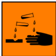
C – żrący